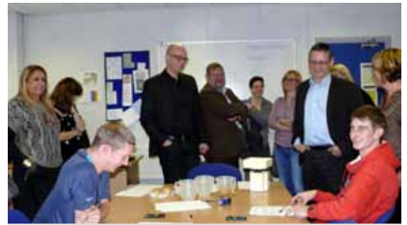
Collegeschüler berichten über ihre Erfahrungen

Auch die menschliche Seite einer Studienreise inspiriert: Durch sie wurde die Studienreise zu einem echten Bildungsergnis. An den Abenden, nach einem oft