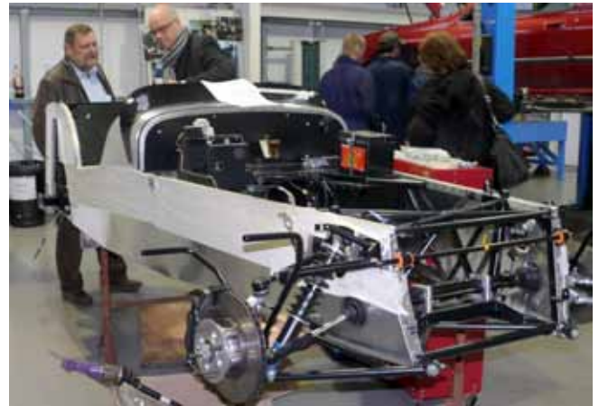
Studienbesuchsteilnehmer informieren sich über die Kfz-Ausbildung im Llandrillo College in Rhos on Sea

Bildungs- und Berufsbildungsbereich haben. Durch gemeinsames Lernen, die Weiterverbreitung bewährter Praxisbeispiele und eine engere europäische Zusammenarbeit tragen sie zur Verbesserung der Bildungs- und Berufsbildungsstrategien auf lokaler, regionaler, nationaler und europäischer Ebene bei. In der Europäischen Kommission koordiniert das Cedefop (Europäisches Zentrum für die Förderung der Berufsbildung) seit dem 1. Januar 2008 die Studienbesuche auf europäischer Ebene. Sie sind in vier Programme unterteilt: Comenius für Schulen, Erasmus für Hochschulbildung, Leonardo da Vinci für Berufsbildung und Grundtvig für Erwachsenenbildung. Die Europäische Union bezahlt ein Stipendium, das Jedem ermöglicht, die Aus- und