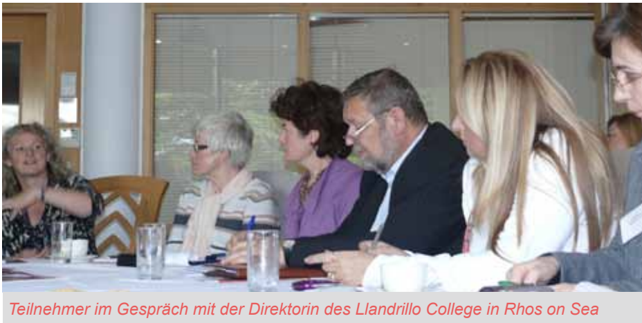
Teilnehmer im Gespräch mit der Direktorin des Llandrillo College in Rhos on Sea

Ein Studienbesuch dauert drei bis fünf Tage und führt zehn bis 15 Bildungs- und Berufsbildungsfachleute aus verschiedenen Ländern mit verschiedenen beruflichen Hintergründen zusammen, um ihre Kenntnisse, ihre Erfahrungen und ihr Fachwissen auszutauschen und über ein Thema von gemeinsamem Interesse zu sprechen. Sie besuchen Bildungs- und Berufsbildungseinrichtungen im gastgebenden Land und treffen politische Entscheidungsträger, Sozialpartner, Lehrer und andere Fachkräfte sowie Lernende, Auszubildende und Studierende. Die Teilnehmer knüpfen Kontakte für eine künftige Zusammenarbeit und nehmen Anregungen mit nach Hause. Es nehmen 33 Länder teil: die 27 EU-Mitgliedstaaten sowie Island, Liechtenstein, Norwegen, die Schweiz, Kroatien und die Türkei.